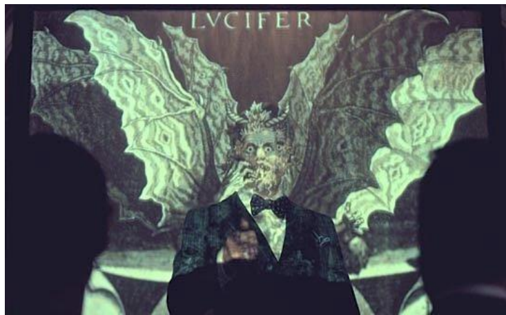
გამოსახულება 6. ჰანიბალისა და ლუციფერის სახე გაერთიანებული, როგორც მისი ეშმაკის მხარის ამსახველი კადრი.