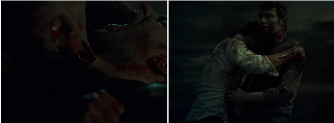
გამოსახულება 4. Crimen + Fructus + Sexus. თავდასხმა, გამოკვება, ინტიმურობა.

დრაკულა ნადირობს ადამიანებზე, ხოცავს მათ და მიმართავს ჩასაფრებული მტაცებლის ინსტინქტს – ელოდება და ჩუმად ეპარება მსხვერპლს, მაგ.: გადაიქცევა კვამლად და ისე ესხმის თავს: