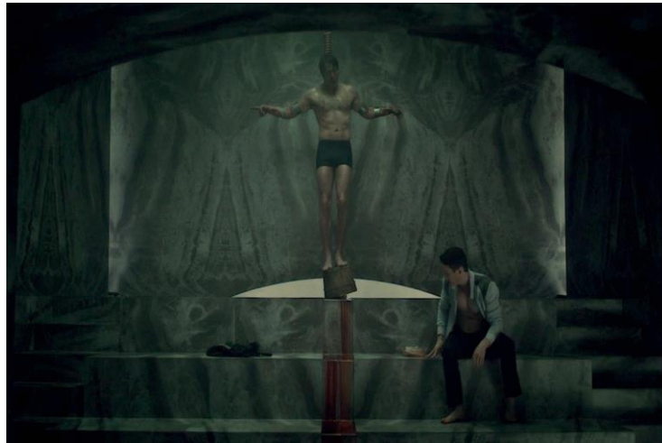
გამოსახულება 5. ჰანიბალი ჯვარზე გაკრული (იგი ირგებდა ღვთის როლს, ამიტომაც კვდებოდა, როგორც ღმერთი).