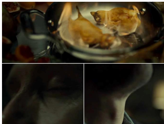
გამოსახულება 3. Fructus + Sexus. კადრი ფოკუსირდება ისე, რომ გამოხატოს სექსუალური კავშირი

Sexus ინსტინქტი ვლინდება როგორც რომანებში, ისე ეკრანიზირებულ ვერსიაში. რომანებში ჰანიბალ ლექტერი დაინტერესებულია აგენტი კლარის სტარლინგით, მიზიდულია მის მიმართ სექსუალურად: „შეეძლო მას ყოველდღიურად ეგრძნო დაუოკებელი შიმშილი მის მიმართ? და დაენაყრებინა მადა დანახვისთანავე? ვფიქრობ, კი“ (ჰანიბალი 2001). სერიალში ჰანიბალის თანამეცხედრე ალანა ბლუმია, მაგრამ ნამდვილი ლტოლვა უილ გრეჰემის მიმართ აქვს. აღსანიშნავია, რომ უილ გრეჰემის მიმართ აქტიურია არამხოლოდ Sexus ინსტინქტი, არამედ Fructus და Crimen-იც კი. იგი ზემოქმედებს უილ გრეჰემზე – უნერგავს ან ეხმარება, დაინახოს შინაგანი ბნელი (აღზრდა/იდეოლოგიის გავრცელება); კვებავს ადამიანის ხორციით (გამოკვებვა); ხშირად აგდებს უილს სახიფათო სიტუაციაში და თავადვე უჭრის მუცელს (Crimen).