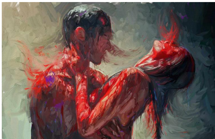
გამოსახულება 1. Bloodshed. Crimen + Sexus + Fructus

უწინარესად, უნდა გამოიკვეთოს მთავარი მსგავსებები მოცემულ ტექსტებს შორის – ინსტინქტები, რომელთა საშუალებითაც მიიღწევა მძაფრი სიუჟეტი და იქმნება დამაჯერებელი ანტაგონისტის(უმეტესწილად ბოროტმოქმედის) სახე: თავდასხმა და გაქცევა (ლათ. Crimen) – საკუთარი ან სხვა ჯიშის მტრებთან კონფლიქტის შედეგად; გამოკვება (ლათ. Fructus) – საკვების მოპოვება და მემკვიდრეობის აღზრდა; გამრავლება (ლათ. Sexus) – მიმზიდველი პარტნიორის შერჩევა(კოხი 1993, 45-46).