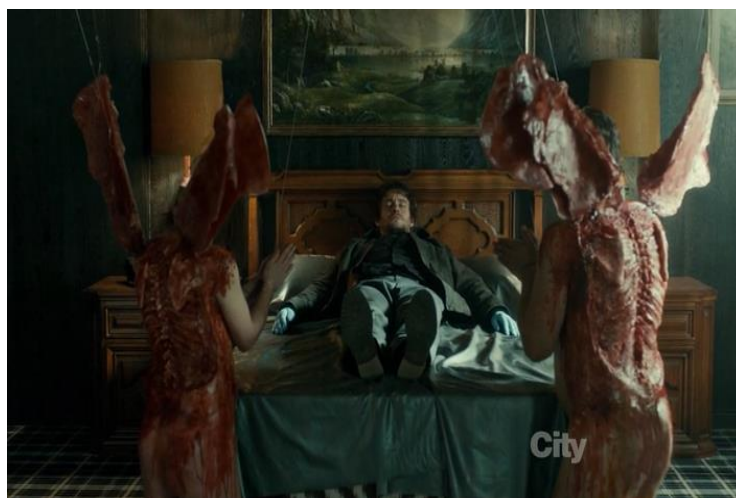
გამოსახულება 7. ანგელოზებად „გარდაქმნილი“ ცხედრები.